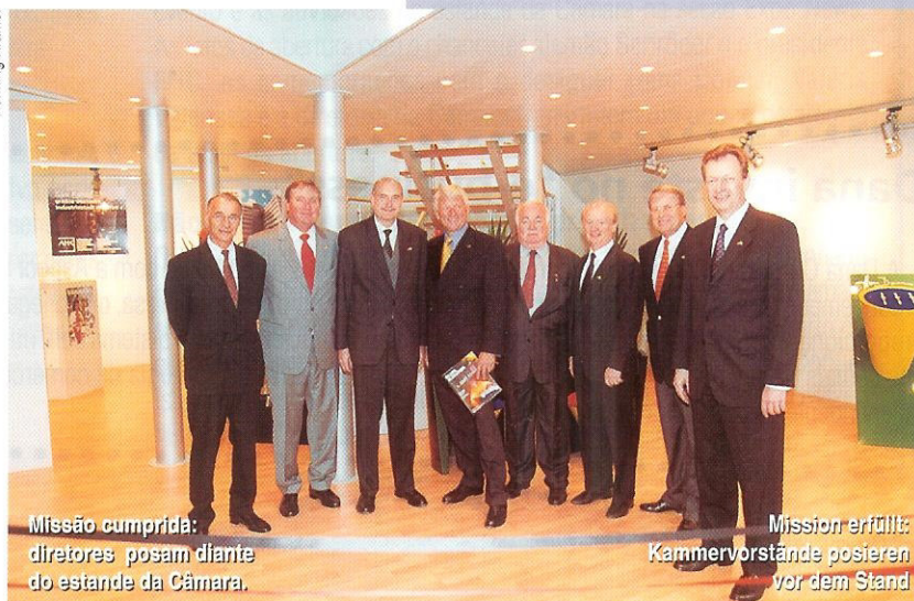
Missão cumprida: diretores posam diante do estande da Câmara.